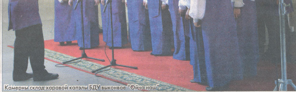
Камерны склад харавой капэлы БДУ выконвае “Ойча наш”.

Намеснік старшыні Пастаяннай камісіі Палаты прадстаўнікоў Нацы-