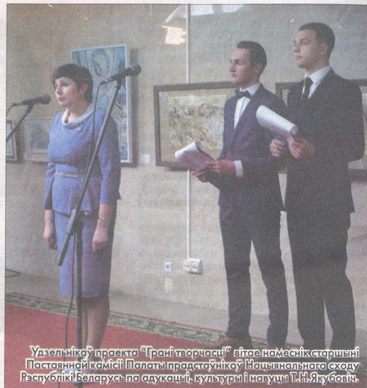
Удзельнік праекта “Грані творчасці” вітае намеснік старшыні Пастаяннай камісіі Палаты прадстаўнікоў Нацыянальнага сходу Рэспублікі Беларусь па адукацыі, культуры і навуцы Т.Н.Якубовіч.

робім усё, каб свята беларускага кнігадрукавання стала падзеяй не толькі нацыянальнага, але і міжнароднага значэння, каб наша краіна магла паўнацэнна заявіць пра свае дасягненні, свае набыткі, свой патэнцыял. А сёння я больш чым